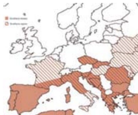
Verspreiding van Dirofilaria immitis en Dirofilaria repens in Europa.

Neemt u uw huisdier deze zomer gerust mee op vakantie. Maar ga er wel tijdig mee naar de dierenarts. Kijk voor veel meer extra informatie op www.sterkliniek.nl Op deze site kunt u de 20 pagina dikke beestachtig leuke vakantiefolder gratis downloaden met alle informatie die u nodig heeft als u met uw huisdier op vakantie gaat en tevens een zeer handige checklist.